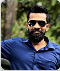
SALVIUS WODSON CEILAO LOGISTICS GROUP