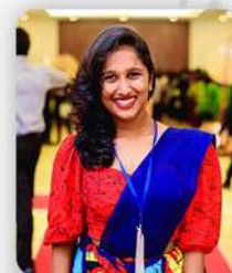
RUWINDI MALLIKAARACHCHI AUSTRALIAN MIGRATION CONSULTANTS