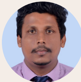
Supun Dewapriya Ceilao Logistics Group