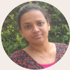
Dineshika Lakmali Ceilao Logistics Group