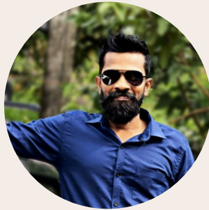
Salvius Wodson Ceilao Logistics Group