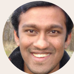
Suni Bastians Australian Strategic Partnerships