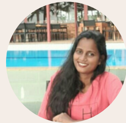
Surangi Fernando Ceilao Logistics Group