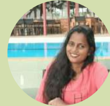
Surangi Fernando Ceilao Logistics Group