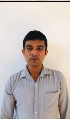
අනුරාධ 122% Acheived