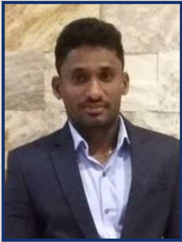
ඉඳහිල් 110% Acheived