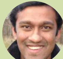
Suni Bastians Australian Strategic Partnerships