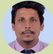
Supun Dewapriya Ceilao Logistics Group