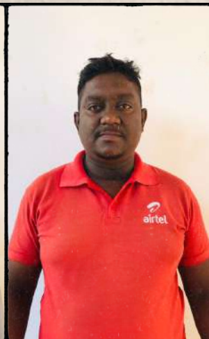
සමිත් 130% Acheived