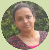
Dineshika Lakmali Ceilao Logistics Group