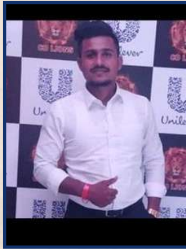
චාමර 102% Acheived