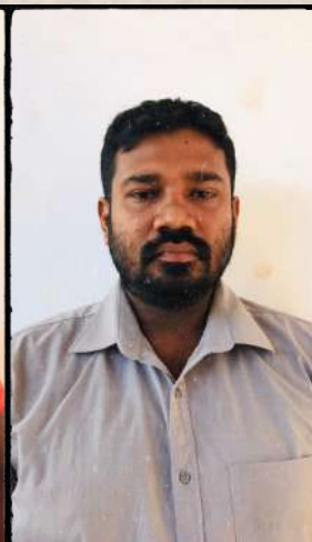
ලක්ශිත 113% Acheived