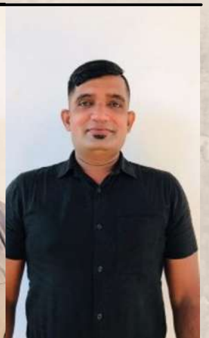
මනිල්ක 125% Acheived