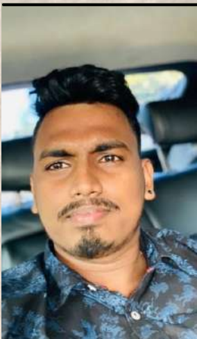
කිසල් 104% Acheived