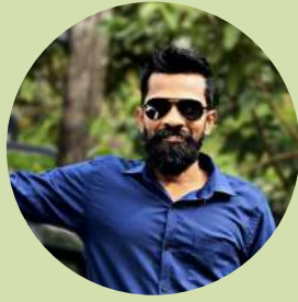
Salvius Wodson Ceilao Logistics Group