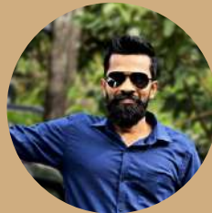
Salvius Wodson Ceilao Logistics Group