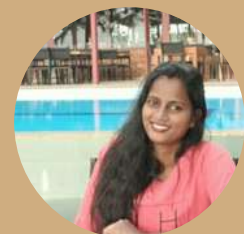
Surangi Fernando Ceilao Logistics Group