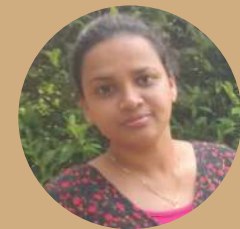
Dineshika Lakmali Ceilao Logistics Group