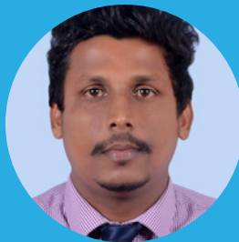
Supun Dewapriya Ceilao Logistics Group