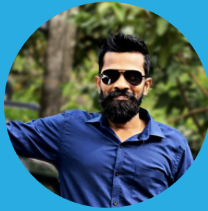
Salvius Wodson Ceilao Logistics Group