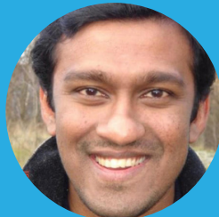
Suni Bastians Australian Strategic Partnerships