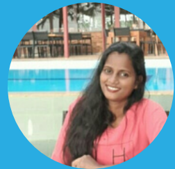
Surangi Fernando Ceilao Logistics Group