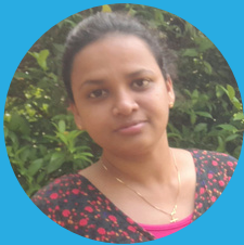
Dineshika Lakmali Ceilao Logistics Group